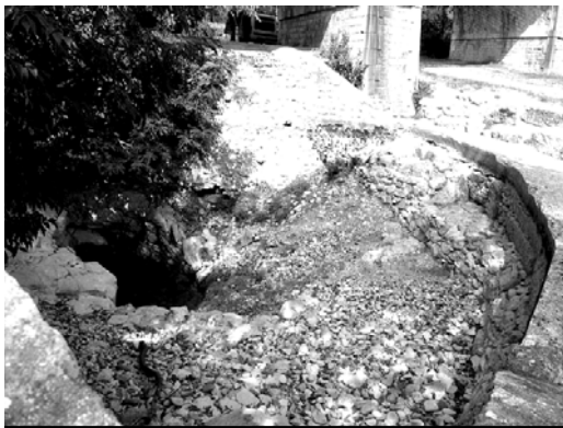
Einstieg Goul du Pont

Den Samstag 4. September nutzen wir für die Anreise, nach 6h Stunden Autofahrt (inkl. Pausen und kleinem Stau) kamen wir in Bourg St. Andéol an. Wir konnten Marco davon überzeugen, dass die Schweizer sehr pünktlich sind. Mit zwei minütiger Verspätung sind wir auf dem Parkplatz eingefahren. Nach der Besichtigung der beiden Höhlen im Dorf war klar, der Einstieg wird gegen unsere Erwartungen beschwerlich sein. Normalerweise steht das Wasser bis knapp unter dem Überlauf. Leider lag das Wasser im Moment 3m tiefer.