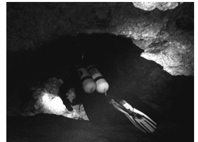
Peacock I, Peanut Tunnel

Am Freitag Morgen stand unser Abschlusstauchgang auf dem Programm. Geplant war ein Rundtauchgang, welcher einen grossen Teil des Peacock I System abdeckte. Die Route führte bei drei verschiedenen Auftauchstellen vorbei. Bei diesen berechneten wir jeweils die Drittelsregel neu. Bis zu diesem Tauchgang hatten wir nur die Verbindung zwischen Cisteen und Olsen Sink noch nicht betaucht. Dies stellte für uns die letzte Unbekannte des Tauchgangs dar. Wir starteten an der Hauptleine in Peacock I , tauchten zum Pothole , 100m (300yard) später folgte ein Jump in den parallelen Gang zum