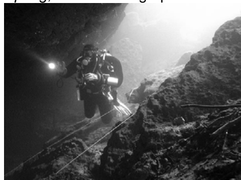
Cavern Zone Peacock I

Strömung? In Europa normalerweise kein Thema. Florida bietet verschiedene Höhlen mit starker bis sehr starker Strömung. Zwei dieser High Flow Höhlen betauchten wir die nächsten beiden Tage: Manatee Spring ; die Strömung spülte uns 3x schneller heraus als wir mit Push and Glide hinein benötigten und Ginnie Spring ; in die Höhle hinein zu kommen, war die grösste Schwierigkeit.