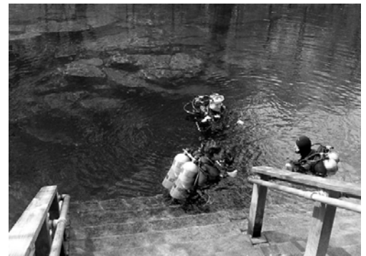
Einstieg Peacock I

Während dem Füllen hatte ich die weiteren Höhlentaucher über verschiedene Einstiege befragt. So versuchten wir uns bei Lower Orange Grove ; gefunden! Mit Rückengerät konnte man ab 30m Tiefe nur noch zickzack-artig in einer geschichteten Spalte abtauchen. Wir warfen einen kurzen Blick auf die Hauptleine (40m