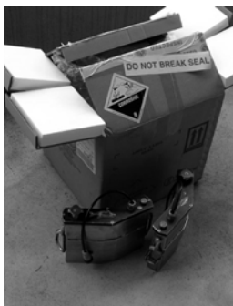
Akku inkl. Verpackung

Zwei Wochen Höhlentauchen vom Schönsten - wie können da die Ferien getrübt werden? - Na klar, mit dem Rückflug. Etwas mehr als 3h vor Abflug war das Mietauto abgeben und wir standen am Check-In. Diesen brachten wir ohne grössere Probleme hinter uns. Ich hatte den netten Mann am Röntgengerät gewarnt, aber es ist seine Pflicht die verdächtigen Koffer zu öffnen. Die Koffer waren gut schweizerisch bis auf den letzten Zentimeter gefüllt. Diese öffnet und schliesst man nicht einfach so. Das musste der Security in zwei Schritten lernen. Die zweite Ladung Gepäck konnte jedenfalls problemlos passieren.