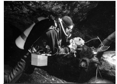
Jump, Ginnie Spring

Hier folgen noch statistische Angaben: In diesen zwei Wochen waren wir insgesamt 37h unter Wasser, dies entspricht einer durchschnittlichen Tauchgangsdauer von ca. 1h40min (22 Tauchgänge). In dieser Zeit legten wir mehr als 22km zurück, das Schwimmtempo lag zwischen 10m/min und 15m/min. Bei meinen ersten Höhlentauchgängen lag das Tempo noch bei ca. 20m/min. Alle Tauchgänge führten wir mit EAN32 durch. Der grössere Teil (14) blieb innerhalb der Nullzeit. Wenn Dekompressionszeiten nötig wurden, blieben sie (fast immer) so kurz, dass sie während des normalen Austauchens erledigt waren. Veratmet haben wir je ca. 70'000lt Nitrox. Im Vergleich zu Frankreich oder Jura mussten wir deutlich mehr Leine verlegen. Total (inkl. den Primaries, d.h Jump von der Tageslichtzone zur Hauptleine) legten wir ca. 30 Jumps. Der kürzeste war 0.5m, der längste (ein Primary) 50m, wir haben nicht den direkten Weg erwischt.