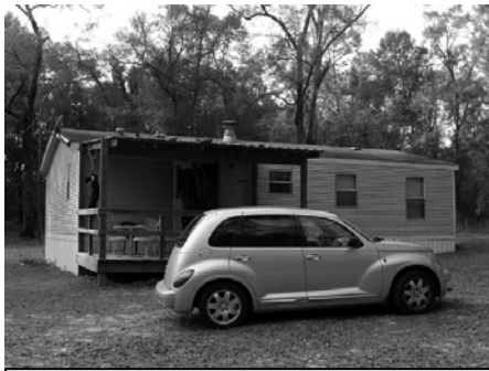
Trailer mit Mietauto

Schon im Jahre 2000 hatte ich den Amerikaner angedroht, dass ich zurück nach Florida komme. Dieses Jahr war es so weit. In der Zwischenzeit hat sich die politische Lage bezüglich Amerikareisen deutlich verschlechtert, d.h. verschärfte Sicherheitskontrollen. Um uns abzusichern führte ich vor dem Abflug ein Telefonat mit der Fluggesellschaft. Die Aussage war, Akkus kommen auf Grund des grossen Gewichtes (ca. 10kg) ins normale Gepäck. Der nette Supervisor des Check-Ins in Zürich verlangte aber, dass wir die Akkus im Handgepäck befördern. Er wollte Verzögerungen beim Abflug verhindern. Als Dankeschön wurden wir bei jedem Check genauer unter die Lupe genommen. Nein, es geht kein Sicherheitsrisiko von den seltsamen Metallbehältern aus!